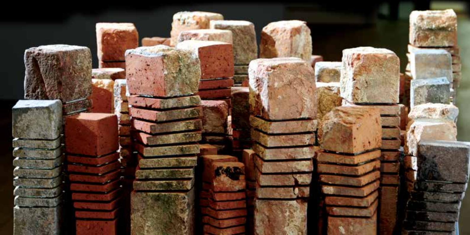
Abbildung Vorderseite: Detailansicht BACKSTEINCITY II, 150-teilig, historische Backsteine, Glas, Höhen ab 16 cm, Ulmer Museum, 2009